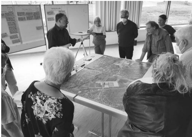
In zwei Arbeitsgruppen diskutierten die Rät/-innen verschiedene Lösungsansätze für die Gestaltung der künftigen Mössinger Sportlandschaft.