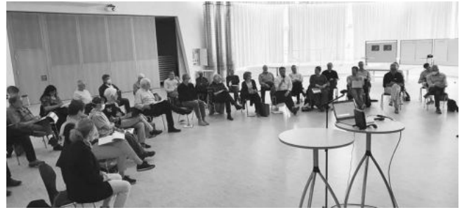
Grundsätzliche Fragestellungen wurden auch in großer Runde nochmals thematisiert und Vor- und Nachteile sorgfältig abgewogen.