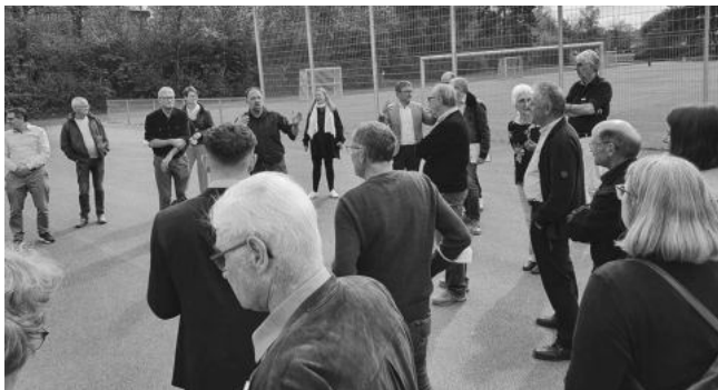
Was man in punkto Sportstätten im Schulzentrum künftig verändern könnte, ließ der Gemeinderat sich vor Ort erläutern.

Am 19. Mai 2022 wird das Sportforum erneut tagen und sich zu den bis dahin noch weiter ausgearbeiteten Plänen austauschen, am 6. Juli folgt eine öffentliche Informationsveranstaltung zum aktuellen Stand. Alle Informationen zum Sportstättendialog und ausführliche Berichte und Protokolle zu den bisherigen Treffen der Arbeitsgruppen finden Sie hier: www.moessingen.de/sportstättendialog